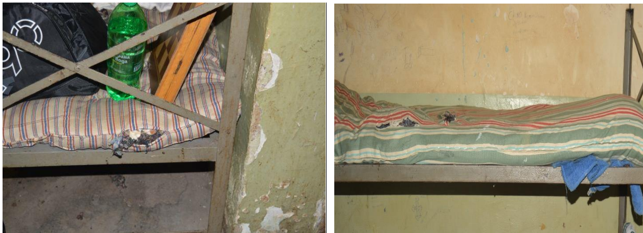
Амортизираните и хигиенно ненадеждни дюшеци

По време на настоящата проверка постъпиха множество оплаквания от лишените от свобода за остарели дюшеци, на които е невъзможно да се спи. Омбудсманът като НПМ е констатирал (не само в този затвор), че дюшеците са амортизирани, морално остарели и хигиенно ненадеждни. Същите са неудобни за спане, което налага лишените от свобода да поставят по 2-3 дюшека на легло.