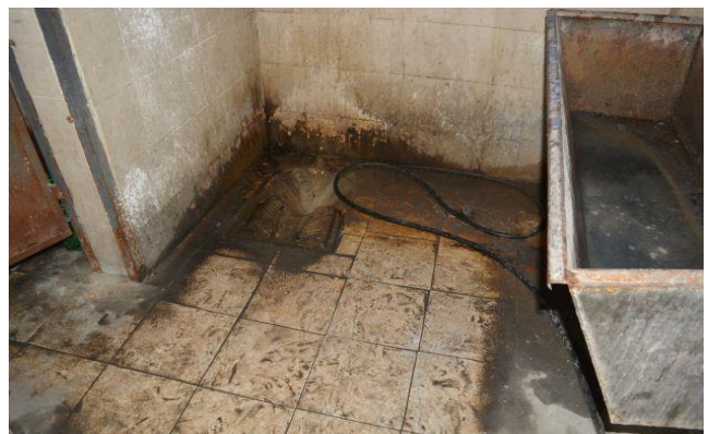
Цехът за пластмасови детайли и санитарният възел към него