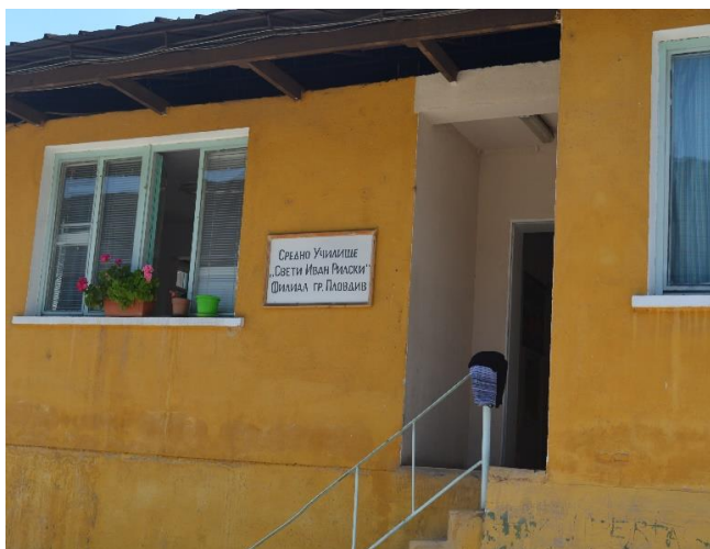
Фасадата на училището

Откритото през учебната 2015/2016 година училище в затвор гр. Пловдив (като филиал на СУ „Св. Иван Рилски“ при затвора – гр. София) продължава да функционира.