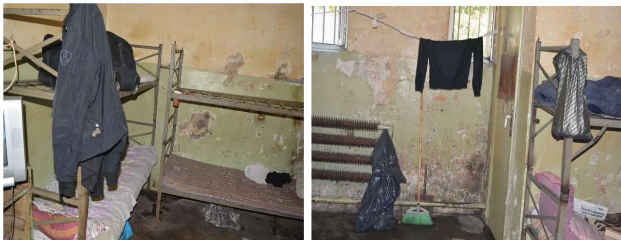
Наличие на влага и мухъл в спалните помещения

В проверените спални помещения се спазваше изискуемата жилищна площ, спрямо броя на настанените лица, но същите не отговарят на изискванията поради наличие на влага и мухъл. Проверващият екип получи множество оплаквания за наличие на хлебарки и дървеници.