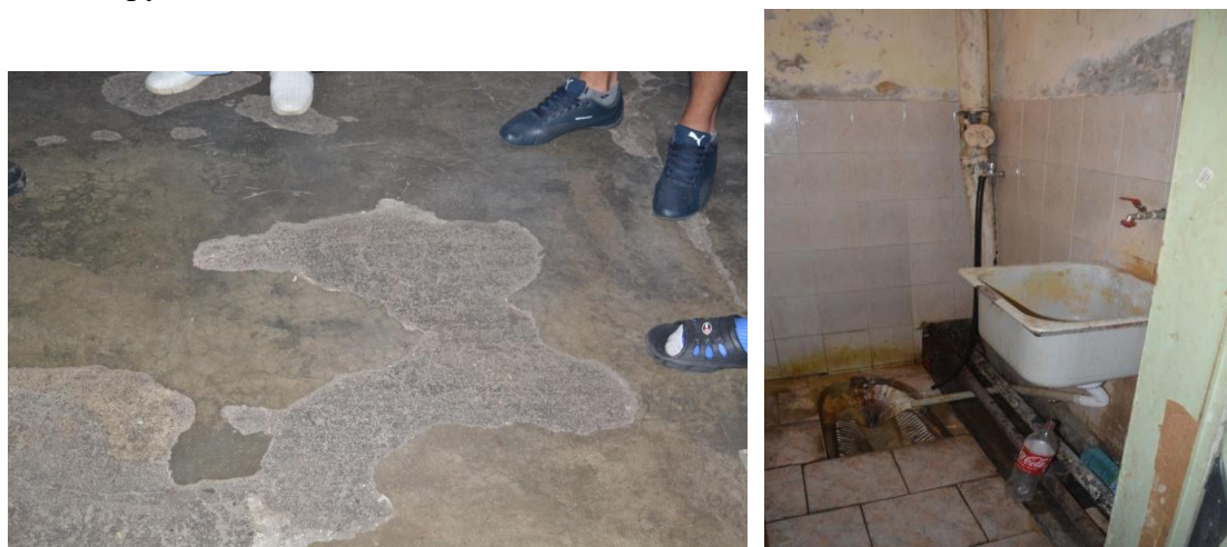
Условията на живот на лишените от свобода

В приемно отделение се спазват 4 кв. м жилищна площ, като стаите са оборудвани с отделен санитарен възел. Тези помещения също не отговарят на изискванията, поради наличие на влага и мухъл, органичен достъп до дневна светлина, а настилката в помещенията е чист (гол) бетон. За цялата 2021 г. през Приемно отделение са преминали общо 551 новопостъпили/лишени от свобода, които съобразно правния им статус се разпределят в групи.