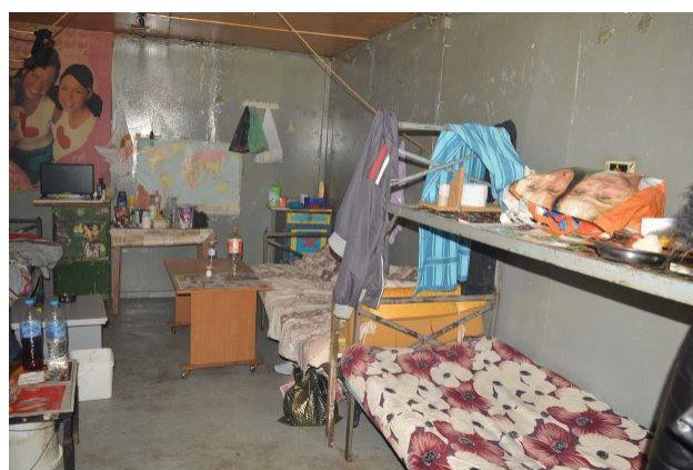
Условията в ЗООТ „Хеброс“